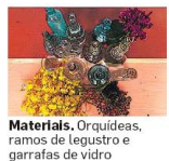
Materials. Orquídeas, ramos de legustro e garrafas de vidro