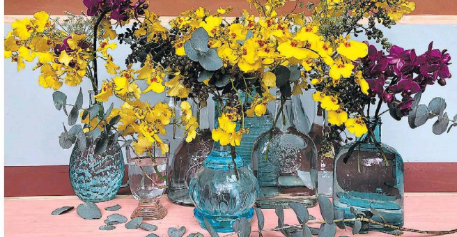
Leveza e transparência. Garrafas de diferentes tamanhos servem de base para composição com orquídeas